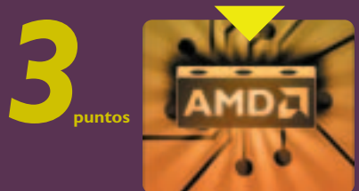
visto desde arriba