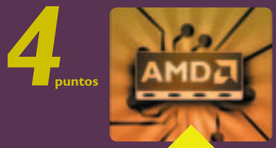
visto desde abajo