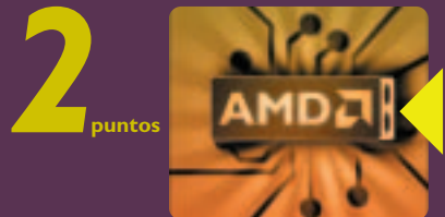
visto desde la derecha