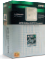
Processeur AMD Athlon™ 64 FX Le top des processeurs pour PC