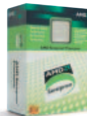
Processeur AMD Sempron™ Des performances exceptionnelles pour l'informatique de tous les jours