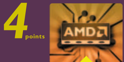
vue de dessous