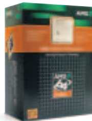
Processeur AMD Athlon™ 64 Des performances de pointe avec un processeur prêt pour l'informatique 64 bits