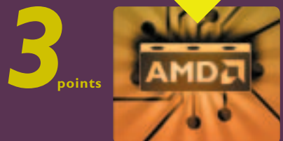
vue de dessus